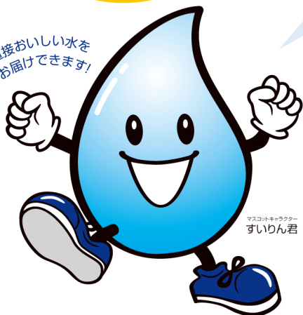
マスコットキャラクター すいりん君